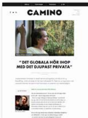
Exempel på sponsrad artikel.

Till dig som annonsör erbjuder vi, förutom banners, en möjlighet att få en sponsrad artikel publicerad på vår startsida. Dessa artiklar visas i flödet på samma sätt som vårt övriga material, men markeras tydligt som en sponsrad artikel i inledningen samt genom att rubriken får en annan färg än vanligt. Sponsrade artiklar skrivs av dig som annonsör och ej av oss på redaktionen.