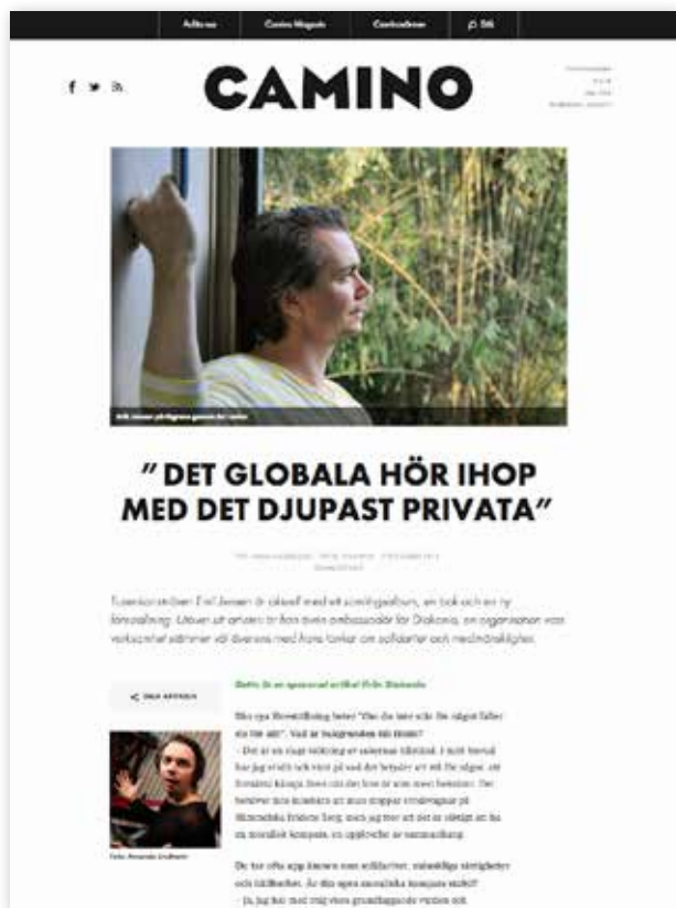
Exempel på sponsrad artikel.

Banners levereras i digital form (Gif, Flash). Banners får vara animerade. Vid användning av Flash skall programversion anges. Sponsrade artiklar levereras som en färdig text med rubrik och ingress (valfri längd), en toppbild i format 980 x 595 pixlar, samt eventuellt en mindre stående bild